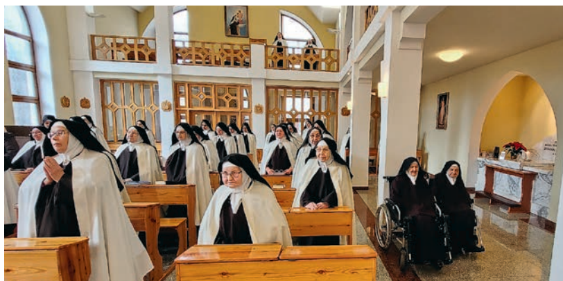
Podczas liturgii w kościele zakonnym