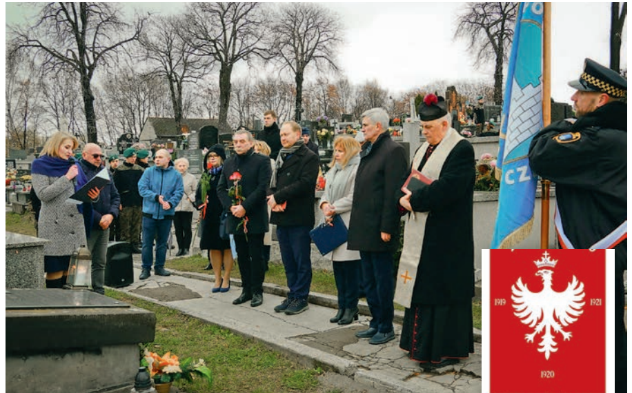
Uroczystość oznaczenia grobów powstańczych w Czeladzi