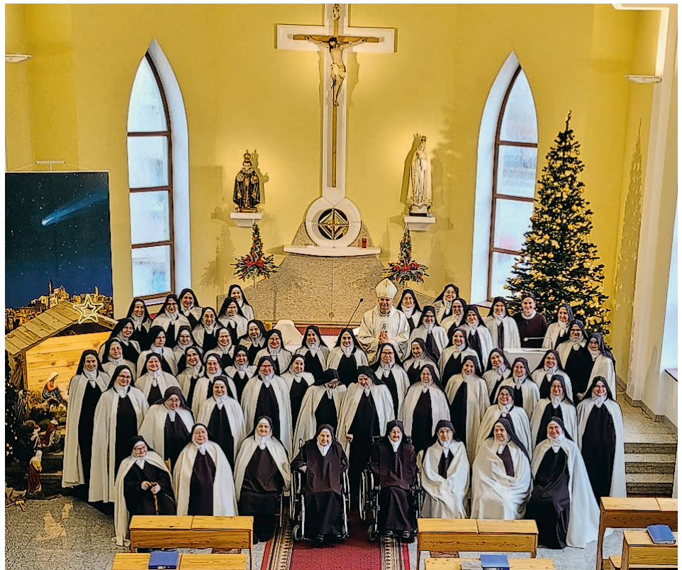
Pamiętkowe zdjęcie z uroczystości